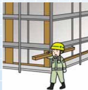
建築や住宅購入にかかる費用は高めだが、補修工事が少なくてすむ。