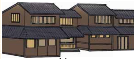
古い町なみや景観の保護につながることもある。