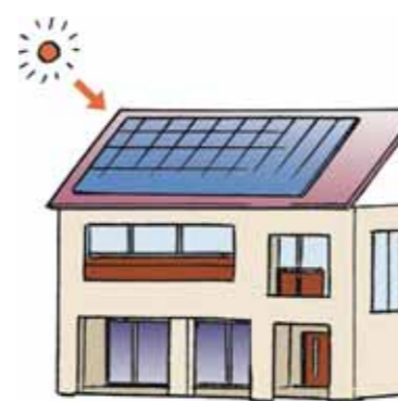
環境や高齢者に配慮した最新設備が整っている。

新築の家やマンションは、省エネになるような設備にしたり、高齢者に配慮したつくりにしたものがあるよ。一方で、古くからある町屋や古民家の良さを生かして、改築しながら住もうという人もいるんだ。 きみが大人になって、自分の家を持つことになったら、最新設備の新築の家やマンションがいい？ それとも伝統家屋を改築した家がいい？