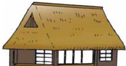
新たに木材など建築のための資源を大量に使わなくてよい。改築や補修工事には費用がかかる。