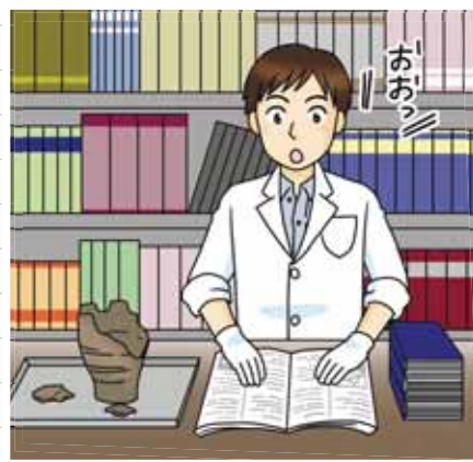
新しい発見をしたり、新しい考え方を見つける力を伸ばしたりすることができる。

これまで日本の大学は、自分の興味のある分野について学んだり、調べたりすることで、知識や考え方を深めるところと考えられてきたよ。 そうすることで、新しい発見や考え方を生み出し発信してきたんだ。 でも最近は、卒業して仕事をするときに、すぐに役立つことを勉強したほうが良いという意見も出てきているんだ。 きみが大学に行って勉強するのなら、仕事にすぐに役立つ勉強がしたい？ それとも、自分の知りたいことを深める勉強がしたい？