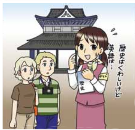
学んだことをそのまま仕事に役立てられないこともある。