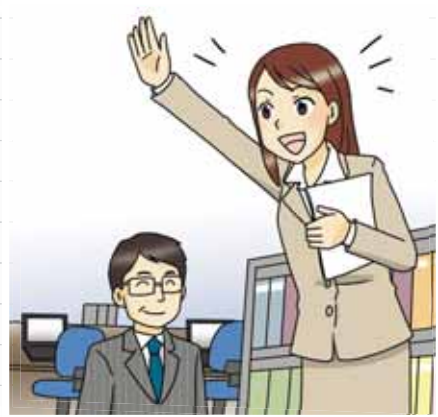
学んだことを仕事にすぐに生かせるので、仕事につきやすくなる。