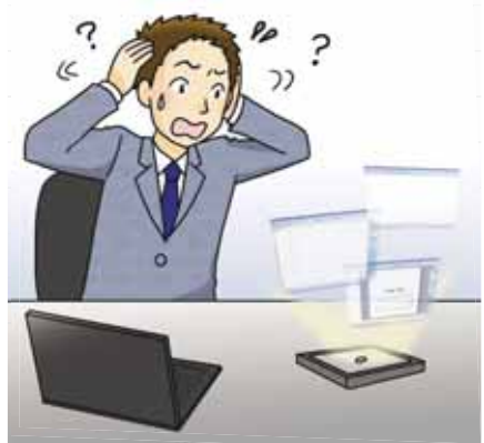
仕事の仕方が変わった場合に、学んだことが役に立たなくなることがある。