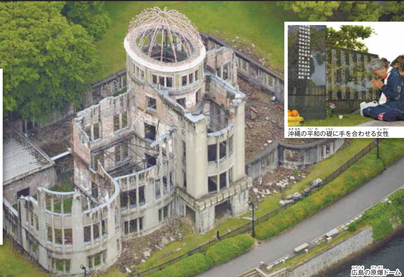
広島市の原爆ドーム