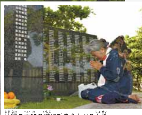
沖縄の平和の礎に手を合わせる女性

今年（ことし）は太平洋戦争（たいへいようせんそう）が終わって70年（しちじゅうねん）だね。きつとみんなも、いろいろな形で戦争（せんそう）のことを知る機会（きかい）があるんじゃないかな。 二度（にど）と戦争（せんそう）をくり返（かえ）さないために、多くの人が犠牲（ぎせい）になった戦争（せんそう）について知（し）ることは大切（たいせつ）だね。でも、戦争（せんそう）が人々（ひとびと）にあたえる苦しみ（くるしみ）を知（し）ることは、つらいことでもあるよね。 きみは、戦争（せんそう）のことをもっと深く知（し）りたいと思う？ それともあまり知（し）りたくないと思う？