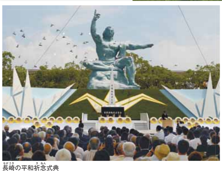
長崎の平和祈念式典